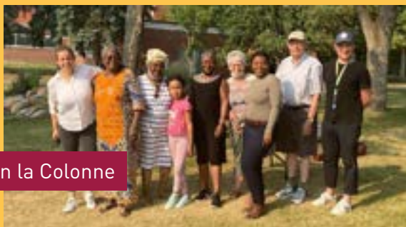
Association la Colonne

Merci à tous ces membres des quatre coins de la province qui sont nos premiers soutiens. Ce chiffre ne dénombre pas tous les membres individuels de chacun des groupes affiliés.